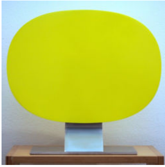
"Spardose - leuchtgelb"

Auflagenobjekt, 1994 in der Plinte signiert und nummeriert „78/100“ Lackfarbe/ handgearbeitetes Edelstahl Objekt ca. 37 x 41,5 x 15 cm (H x B x T)